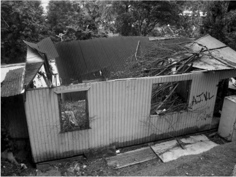
(Casa Expropiada por el Municipio de Guaynabo)

cipio. En principio, se trataba de unas viviendas adosadas de protección oficial, y con las cláusulas que son típicas de este tipo de viviendas: no se puede sub-arrendar, no se puede vender en un periodo de diez años. Si vas a vender, le tienes que re-vender al Municipio por la misma cantidad de la venta original, y no se puede construir. El costo del “walk-up” (piso de protección pública) de tres habitaciones era de aproximadamente 90 mil dólares, y a este balance se le acreditaría el valor de la tasación de la propiedad entregada. El balance pasaría a formar parte de un préstamo hipotecario garantizado por el gobierno, y el Municipio aportaría tres mil dólares anuales al pago de la hipoteca en forma de subsidio. Una vez la transacción se completaba, la casa que entregabas era inmediatamente destruida con una grúa mecánica, y el predio cercado para evitar que sea ocupado por otro invasor. Muchos vecinos, sin embargo, decidieron no mudarse a los “walk-ups” (piso de protección pública) y, de hecho, el Municipio se vio obligado a vender algunos de los “walk-ups” (piso de protección pública) a otros empleados municipales que venían de fuera de la comunidad.