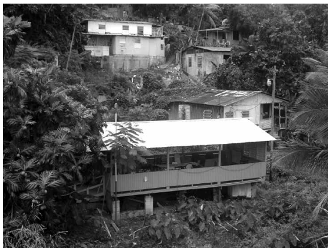
(Casita de Reuniones, Comunidad Los Filtros)